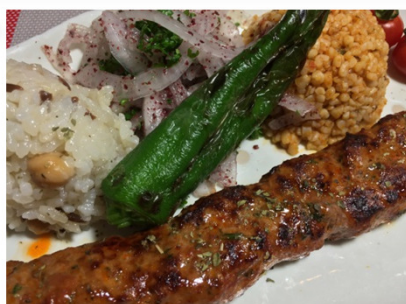
Urfa kebab ウルファケバブ

1,520円 トルコ中南部アダナ地域のケバブ ラム挽肉100%のスパイシーケバブ 辛いのが苦手な方は ウルファケバブをどうぞ