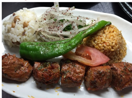
Kuzu şiş ラムのシシケバブ