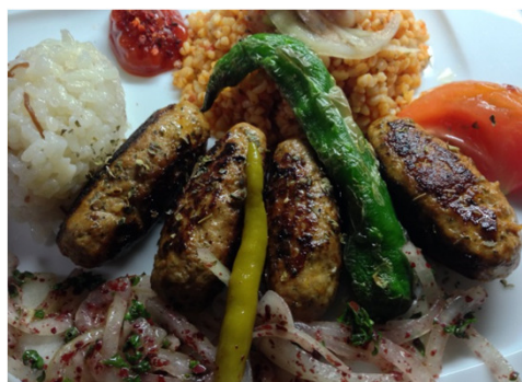
Köfte キョフテ 1,550円 ラム挽肉100%のハンバーグ 付け合せはケバブプレートと同じです

1,520円 トルコ南東部ウルファ地域のケバブ ラム挽肉100%のマイルドケバブ スパイシーなケバブがお好みの方は アダナケバブをどうぞ