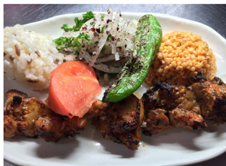
Tavuk şiş タヴクシシ (チキンのシシケバブ)