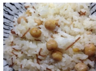
Pilav ピラウ 350円