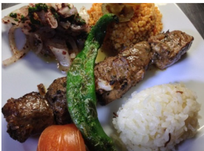
Dana şiş ビーフのシシケバブ 1,620円 ビーフの串焼き 脂分の少ないモモ肉を 丁寧にトリミングしています